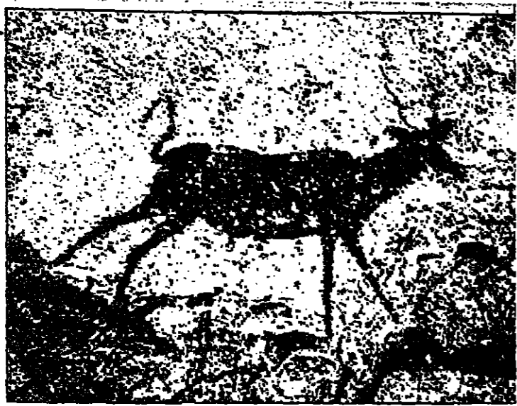
نقطة المراقبة في رسم الحيوان براعة في الانتعاش الشكلي من فنون ما قبل التاريخ